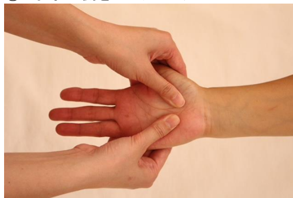
④ 手掌内側をプレッシング