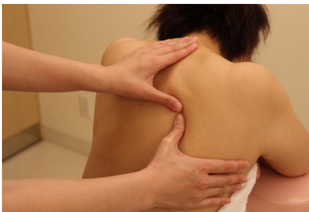
⑤ 手掌や拇指にて肩甲骨周辺のフリクション