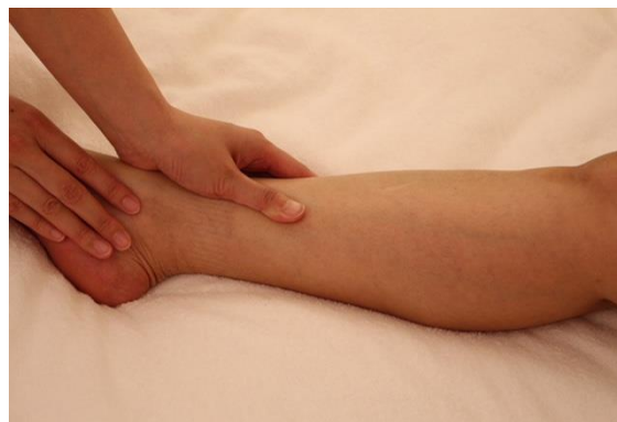
② 下肢内側のエフルラージュ&プレッシング