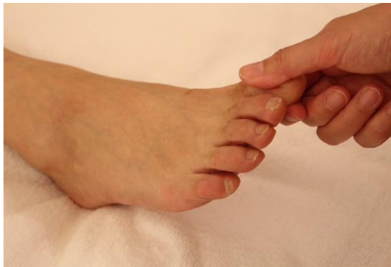
⑥ 足趾のプレッシング