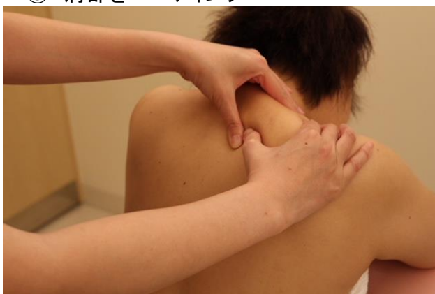
③ 肩部をニーディング