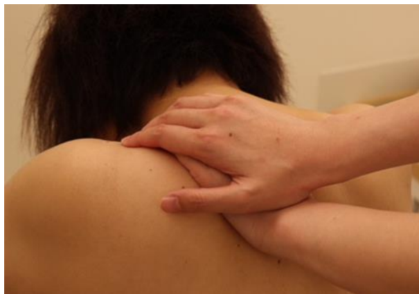
② 僧帽筋と三角筋への8の字エフルラージュ