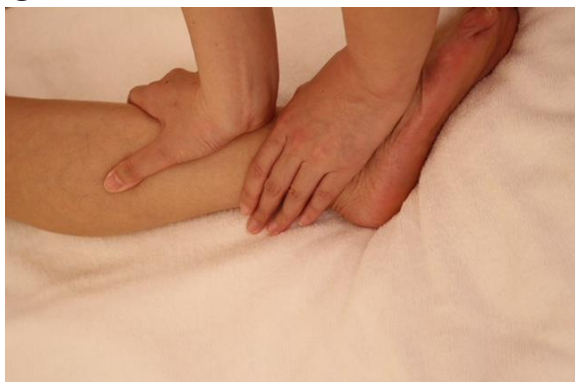
③ 下肢外側のエフルラージュ&プレッシング