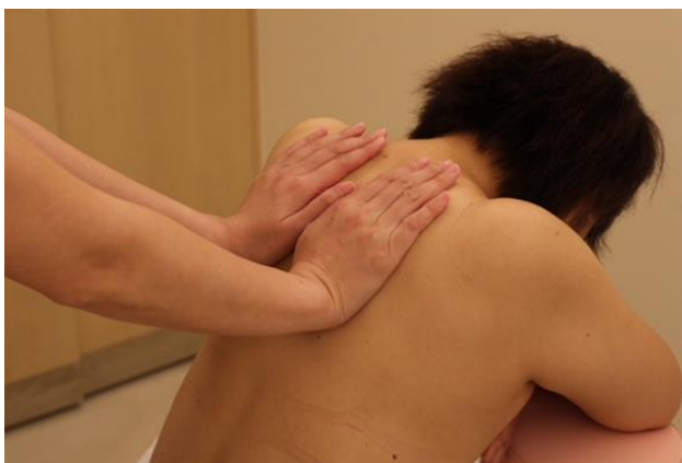
① 部から上腕のエフルラージュ