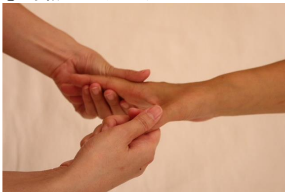
⑤ 手指のプレッシング