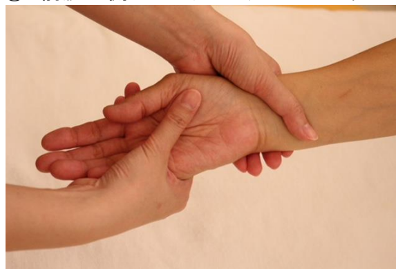
② 前腕内側のプレッシング&エフルラージュ