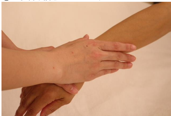
① 手背、前腕のエフルラージュ