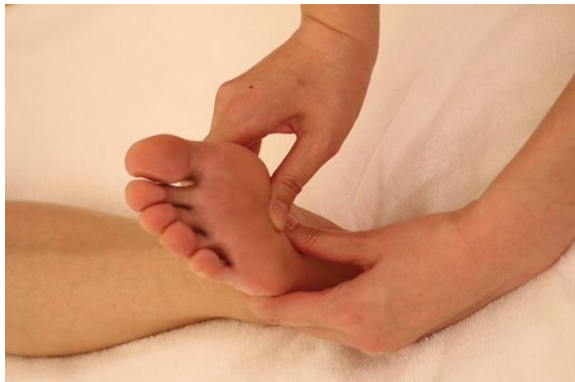
⑤ 足底のプレッシング