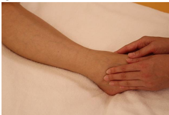
④ 外踝、内踝のプレッシング&フリクション