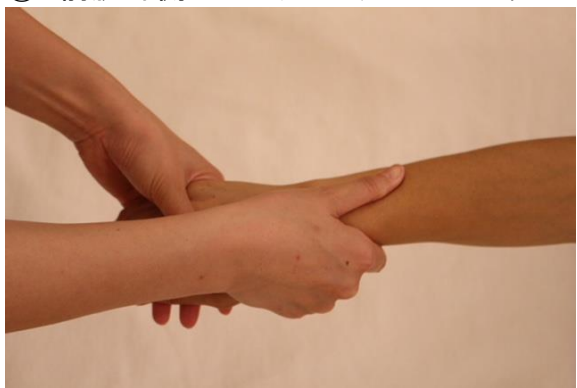
③ 前腕外側のプレッシング&エフルラージュ