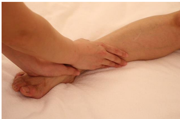
① 足背、下肢のエフルラージュ